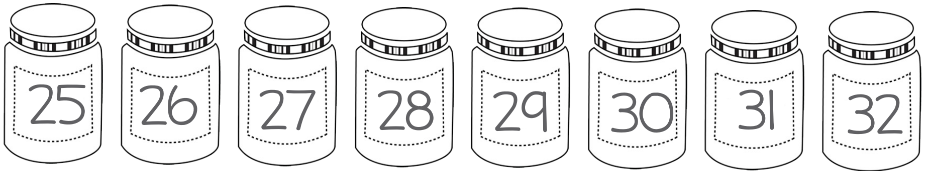
Tableau des participants